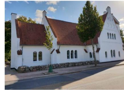
Kirken på Graabjergvej