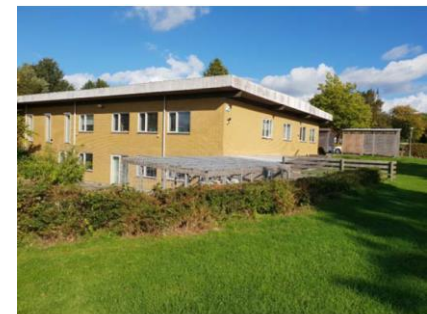
Kommunal IT- bygning indenfor området